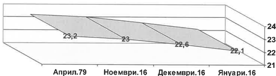
Равнище на безработица, %

3. Равнището на безработица към 31.01.2017 г. изчислено на база икономически активното население, по данни на АЗ, възлиза на 22,1%.