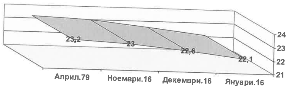
Равнище на безработица,%